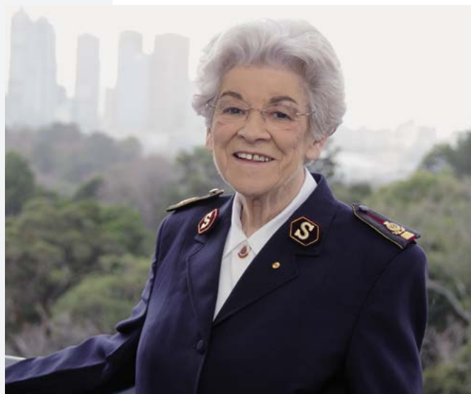
Eva Burrows Generaal in het Leger des Heils van 1986 tot 1993

Geleidelijk aan is de missie die door vrouwen in het Leger des Heils wordt uitgevoerd, via de afdeling Women's Ministries