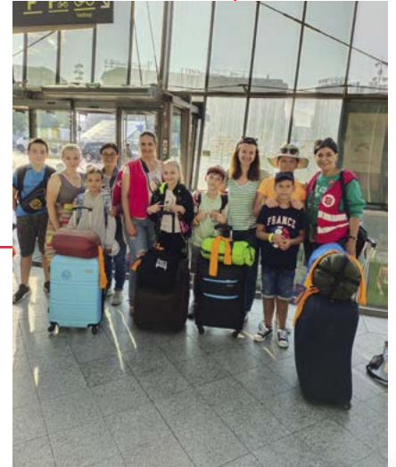
Hier start de vakantie voor een aantal kinderen uit Oekraïne

In augustus konden zo'n veertig mensen een uitstap maken naar de Noordelijke Vogezes. Deze vakanties kunnen alleen maar gunstig zijn voor de families die zulke droeve tijden doormaken. Deze momenten zijn een essentiële hulpbron en stelt kinderen ook in staat om net als de andere vakanties te hebben, waarover ze kunnen vertellen bij de start van het schooljaar. In juli namen vijf kinderen deel aan het kamp Cadet Torchbearer (verkennersactiviteit) in het Centre de Chausse, in de Cevennestreek.