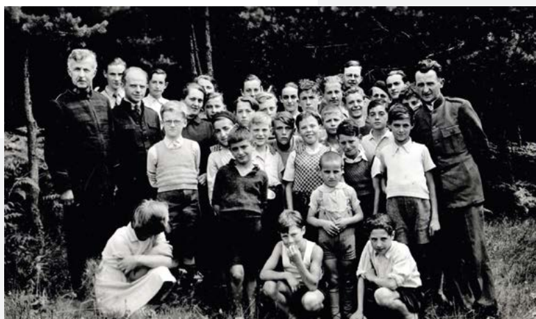
Op kolonie in Barandons

Geconfronteerd met de tekortkomingen van de samenleving ten aanzien van de arbeidersklasse in de 19 e eeuw, stelde William Booth, de stichter van het Leger des Heils, een systeem van sociale regeneratie voor dat gebaseerd was op het principe van kolonies in de steden, dan op het platteland en tenslotte in de overzeese gebieden.