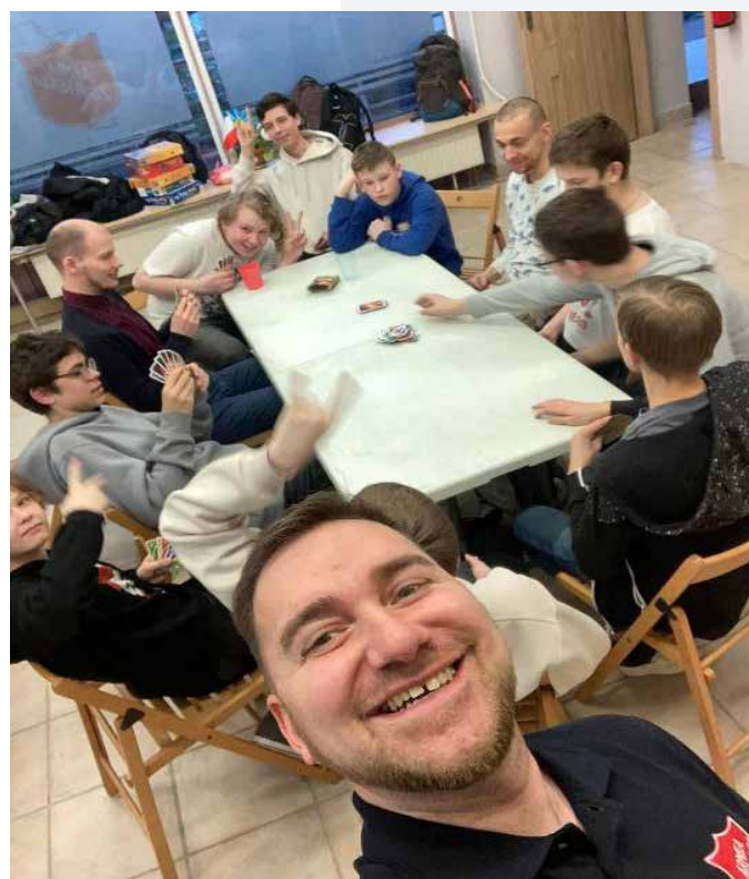
Ontspanningsmoment met de kinderen