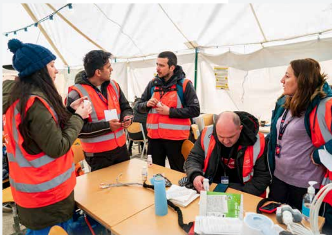
Vluchtelingenkamp in Roemenië

Als reactie op de humanitaire noodsituatie in Oekraïne heeft het Leger des Heils van Roemenië onmiddellijk teams ter plaatse ingezet. Officieren van het Leger des Heils hebben vluchtelingen uit Oekraïne opgevangen en onderdak geboden. In Roemenië, Moldavië en Oekraïne, in de sneeuw, in de zon, bij vriestemperaturen, blijven de teams zich mobiliseren om mensen die de bombardementen in Oekraïne ontvluchten, op te vangen en onderdak te bieden. Naast de eerste levensbehoeften (voedsel en hygiëneproducten) zijn aan de gezinnen simkaarten uitgedeeld, zodat zij contact kunnen houden met hun verwanten. Er worden ook folders in het Oekraïens verspreid onder vluchtelingen om hen aan te