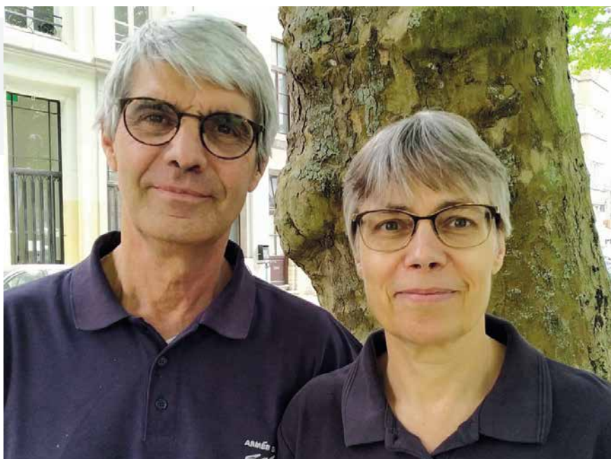
Frank en Bluette