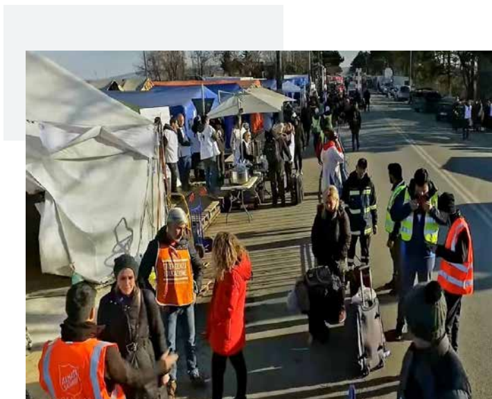
Hulpdiensten aan de Roemeense grens

De afgelopen twee maanden ben ik betrokken geweest bij het helpen van Oekraïense vluchtelingen aan de Siretgrens en in Boekarest zelf. Het is een grote verantwoordelijkheid, maar ook een goede gelegenheid om liefde en zorg aan anderen te tonen. De verhalen die ik hoorde raakten me diep, vooral die van vrouwen en kinderen die de oorlog in Oekraïne ontvluchtten. Als lid van het team hebben wij, samen met andere vrijwilligers en officieren van het Leger des Heils, deze mensen geholpen met materiële steun (kleding, voedsel, speelgoed voor de kinderen, dekens en dergelijke), maar ook met informatie, morele steun, folders over preventie van mensenhandel en onderdak in de korpsgebouwen. Wat mij hiertoe aanzette was de gedachte dat, als ik in dezelfde situatie zou verkeren als zij, ik graag zou