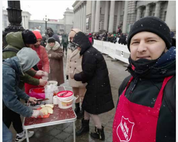
Dinopo ein Oekraïne

moedigen op hun hoede te zijn voor netwerken van moderne slavernij die hen proberen te rekruteren.