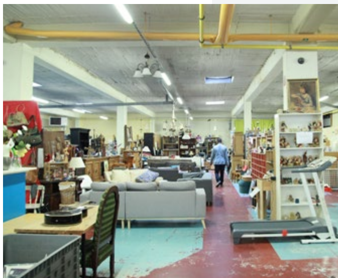
De winkel Het Trefpunt biedt een ruime keuze aan leuke spullen en tweedehandskleding

Het verminderen van sociale ongelijkheid is een belangrijke missie van het Leger des Heils. Onze tweedehandswinkel "Het Trefpunt" in Antwerpen stelt alles in het werk om haar klanten milieubewust te laten aankopen.