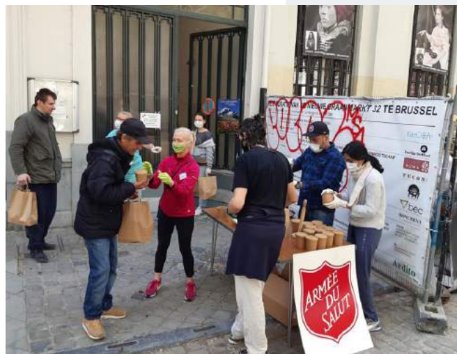
Voedselbedeling in Brussel, met medewerking van de vrijwilligers van de vereniging Serve the City

Voorheen werden er ongeveer 60 maaltijden per week uitgedeeld aan de daklozen en behoeftige mensen.