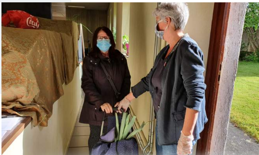
Voedselbedeling in Seraing