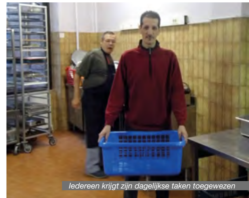
Iedereen krijgt zijn dagelijkse taken toegewezen

Ondanks de onderlinge verschillen is het fijn om vast te stellen dat de bewoners respect hebben voor elkaars overtuiging en hun tradities. Er worden in een aangename sfeer gedachten gewisseld tussen gelovigen en andersdenkenden.