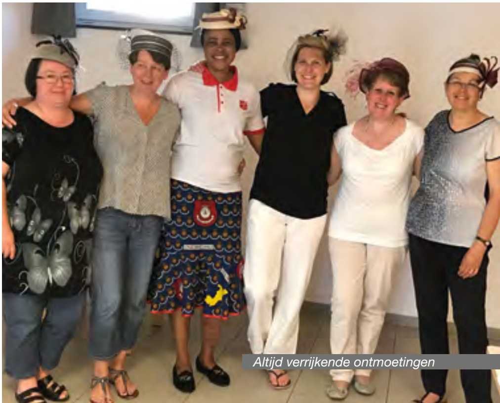
Altijd verrijkende ontmoetingen

Het is waar dat ik in het begin niet begreep waarom God mij had geroepen om Hem als officier te dienen. Ik heb moeten leren om over mijn verlegenheid heen te stappen om het Woord van God te verkondigen. Maar het zijn de persoonlijke contacten die me de meeste voldoening geven. God geeft me de middelen om te doen wat Hij van me vraagt, zelfs al ben ik altijd zenuwachtig als ik voor een publiek moet spreken.