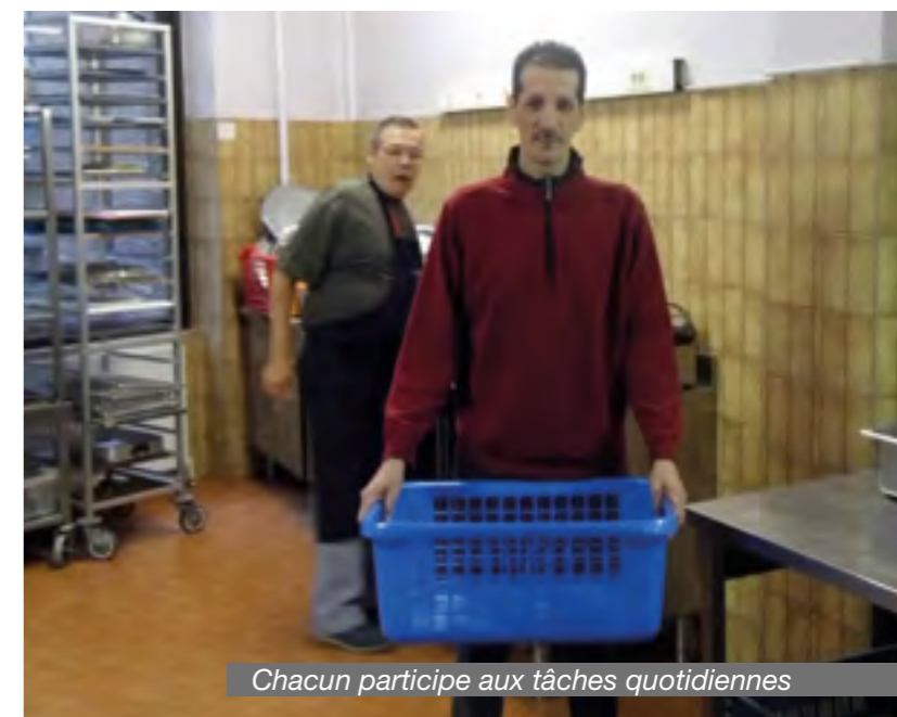
Chacun participe aux tâches quotidiennes

L'occupation proposée est axée sur l'entretien, la cuisine, la rénovation du bâtiment, le ramassage ou la vente par le biais de notre magasin de seconde main « Le 24 » : vêtements, mobilier, petit et gros électroménager.